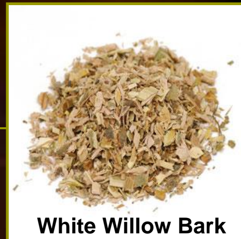
White Willow Bark